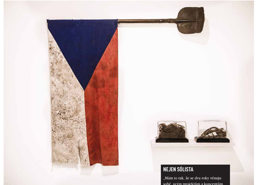
Výstava Im Boden je v DSC Gallery k vidění do 13. 6. 2017.

žaludek. Začal jsem s ním pracovat jako s materiálem. Vzal jsem jich pár, nechal je vyschnout a udělal sousoší, které připomíná německé vojáky, dokonce jsem jim dal identifikační známky vykopané ze země. Začal jsem jim zjednodušeně říkat zrůdy. Je v nich symbolika nažraného žaludku, protože obě strany toho sporu se přece chtěly navzájem vyžrat.