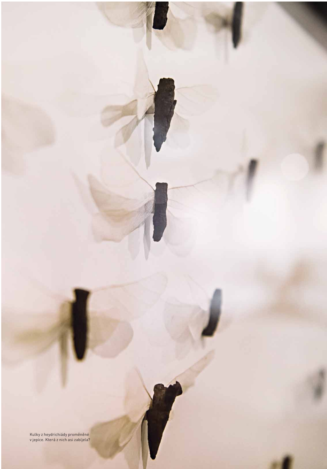
Kulky z heydričiády proměněné v jepice. Která z nich asi zabijela?