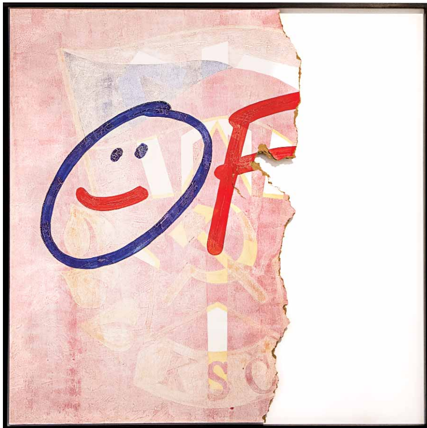
Nové symboly překrývají staré. I to je další rozměr výstavy.