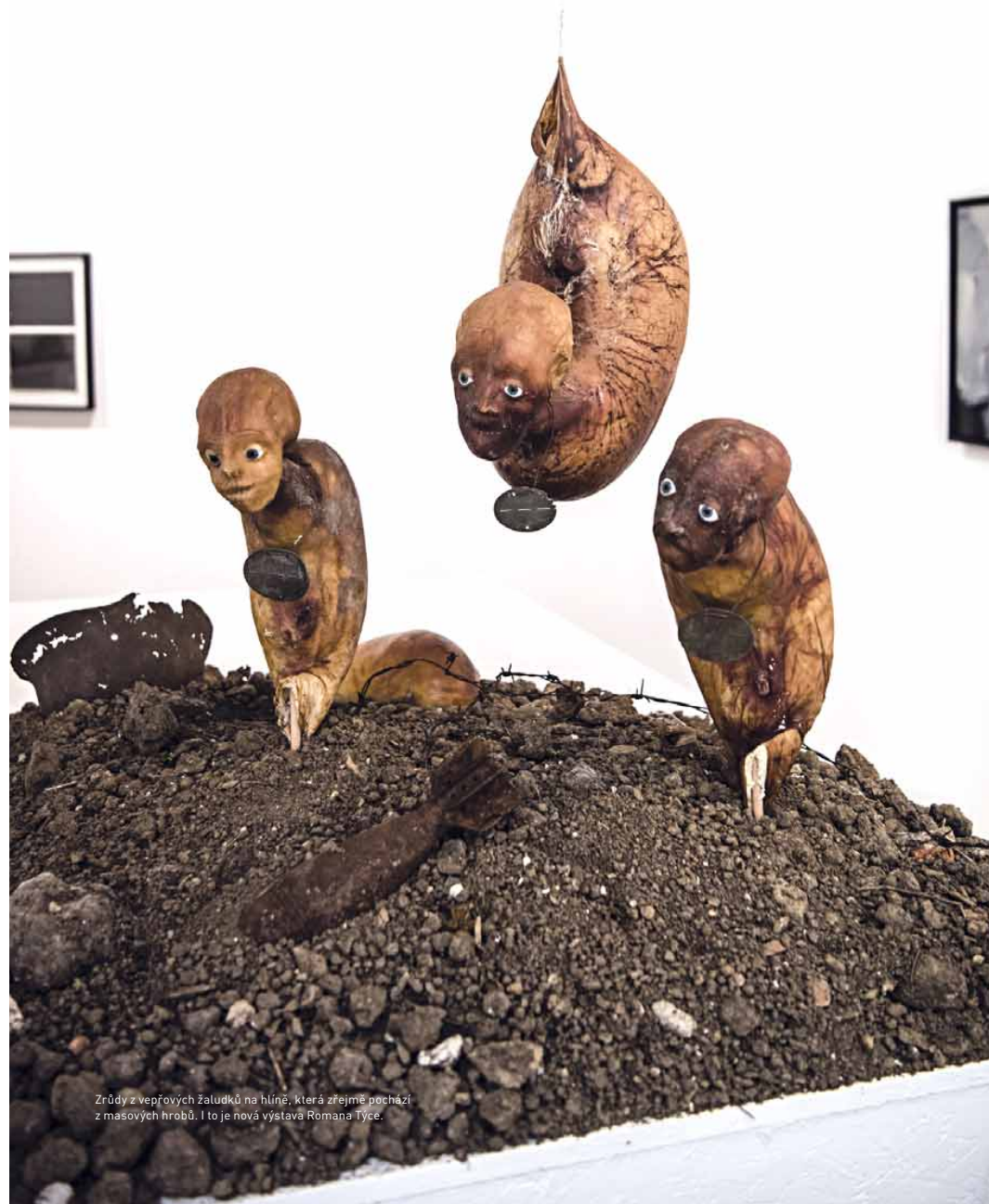
Zrůdy z vepřových žaludků na hlině, která zřejmě pochází z masových hrobů. I to je nová výstava Romana Týce.