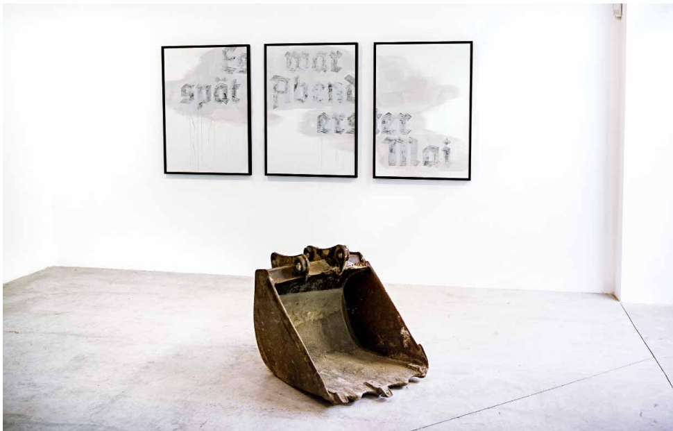
Citáty z Máchova Máje Týc vyvedl Švabachem a přetřel na bílo.

nějaký zrezlý bouchačky. A on mě uvedl do světa lidí, kteří ze země hrabou neuvěřitelné věci. Běžně třeba nachází hroby s mrtvolama, které na sobě mají kovové věci. Tak si je vezmou a zase zahrabou. Ono se o tom nemluví, ale v podstatě ty hroby vykrádají. Ale o to nejde, jsou to historický nadšenci.