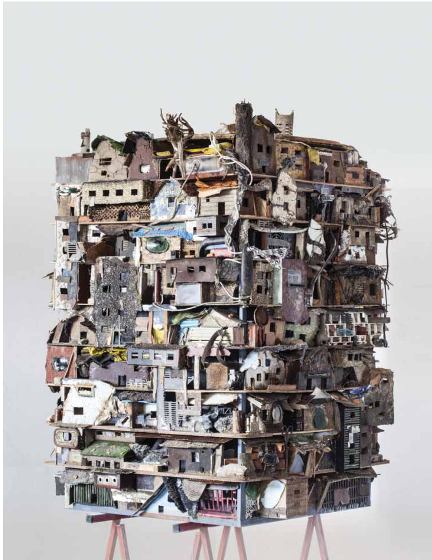
Slumhouse, 2015. Kombinovaná technika, cca 1,5 x 1 x 1,5 m, soukromá sbírka.