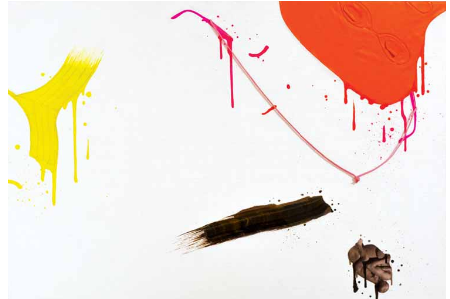
Akční intarzie, 2017, 85 x 60 cm, polychromovaná intarzie, kombinovaná technika

s ní příliš neidentifikoval. Jak už to bývá, byl jsem jí pohlcen, takže ať chci, nebo ne i já jsem postmodernák. Najednou mi přišlo, že je to celé špatně. Že místo toho, abychom přemýšleli dopředu a vznikaly nové věci, osvozujeme se dozadu. Nikdy jsem nezavrhal staré umění, ale neměl jsem potřebu ho opakovat nebo znovu interpretovat. To mi přišlo snadné, ale oni to všichni v Praze, ale vlastně i ve světě dělali!