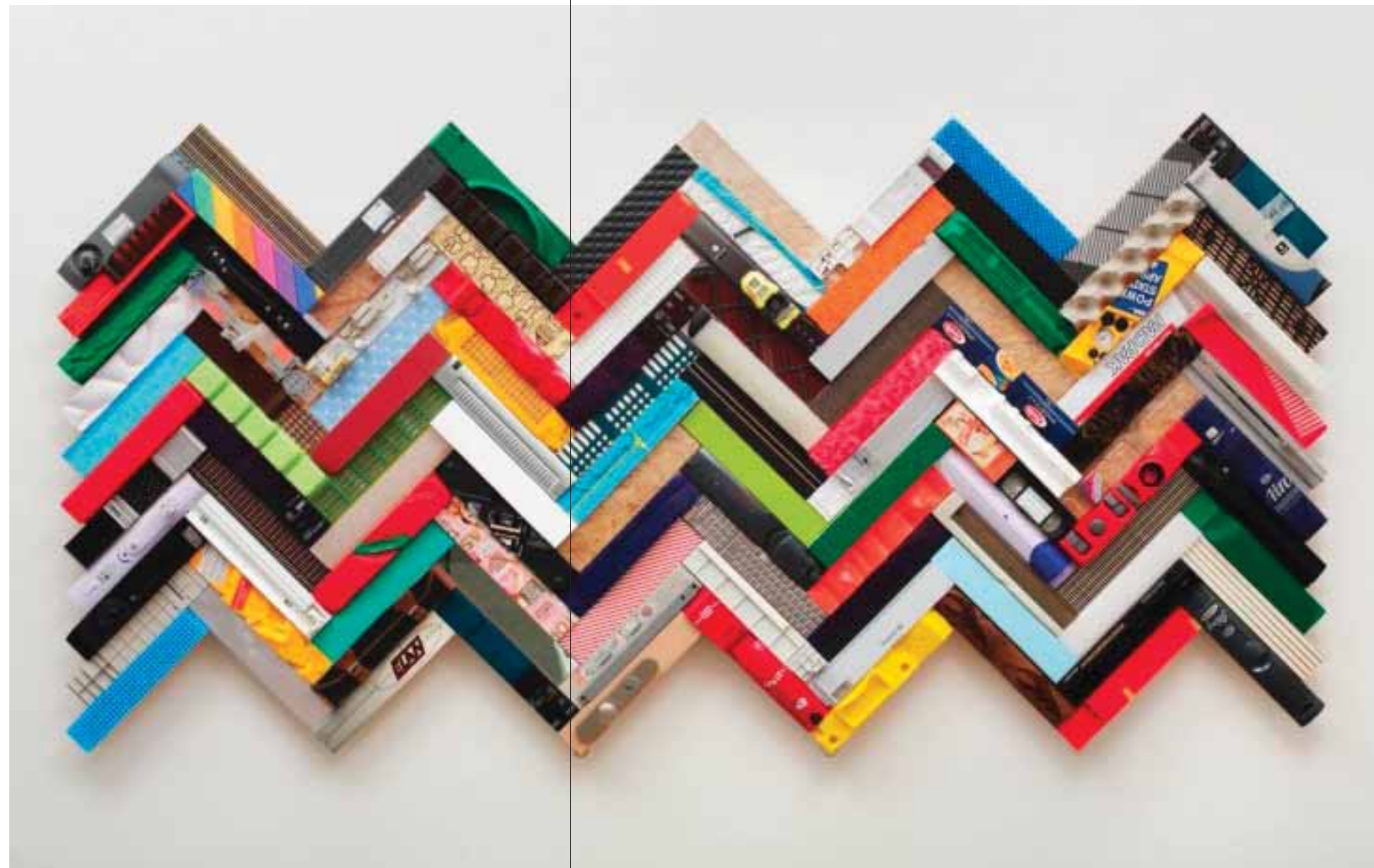
Stav přitažlivého opovrčení, 2012, kombinovaná technika, 300 x 100 x 10 cm

Těžko říct, ale asi trochu jo. Třeba v tom, že jsem si od Franty Skály koupil kytaru a rozhodl jsem se, že když jsem na ni chtěl celý život umět, tak ještě než chcípnu, přijdu tomu na kloub. Vim, že celý život hraju na kytaru blbě. Tak si platím učitele.