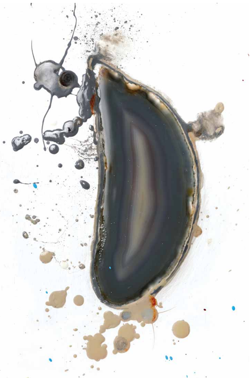
Action Ends, 2017, 140 x 100 cm, intarzie v dřevě, syntetika, akryl, detail